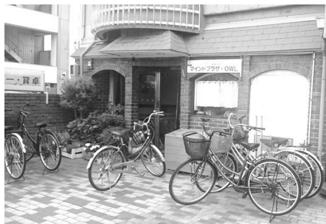
喫茶「マインドプラザ OWL（アウル）」

明星福祉会を最適な形で支えるために、法人のみなさんにも声をかけ、そして会員みなさんのご意見にも耳を傾けていきたいと思えます。これからも多くの意見、遠慮なく聞かせてください。